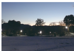
夜間の公園や学校の部活動に