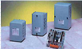
電源装置、制御装置