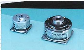
無励磁作動ブレーキ