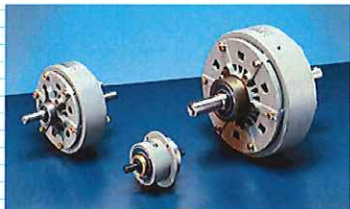
パウダークラッチ・ブレーキ