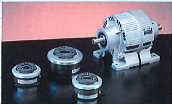
乾式単板クラッチ・ブレーキ