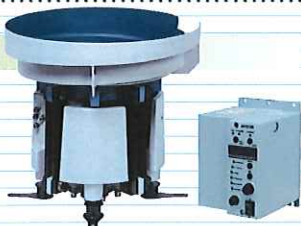
パーツフィーダ コントローラ